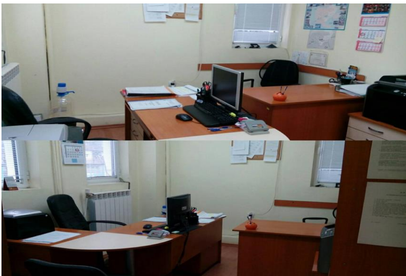
Звено Панагюрище е с адрес ул."Орчо Войвода" №4 0879001521